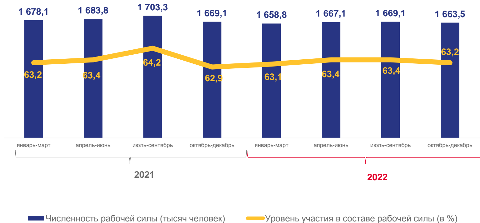
Динамика численности рабочей силы